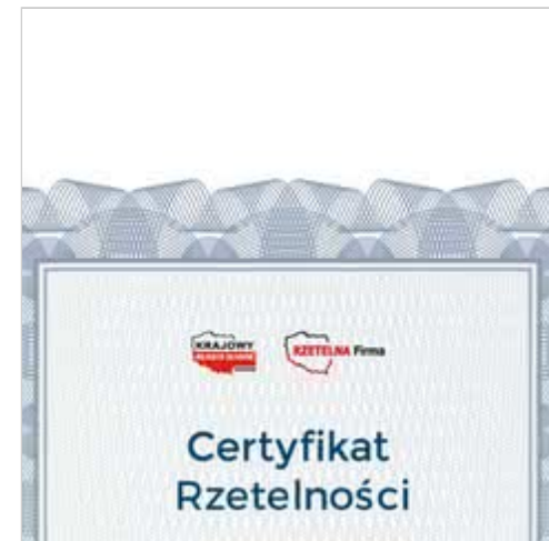
AS PPH z certyfikatem Rzetelna Firma