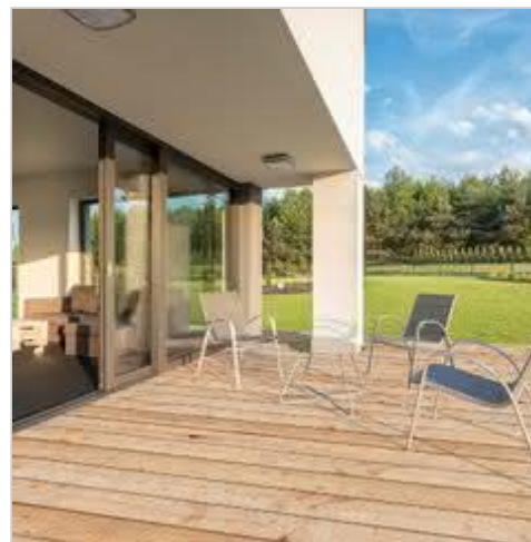
Syberyjskie piękno na tarasie - deski tarasowe z modrzewia syberyjskiego