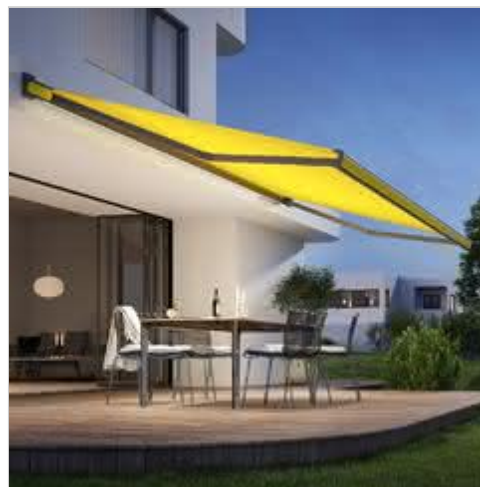
Wzornictwo markiz w najlepszej formie